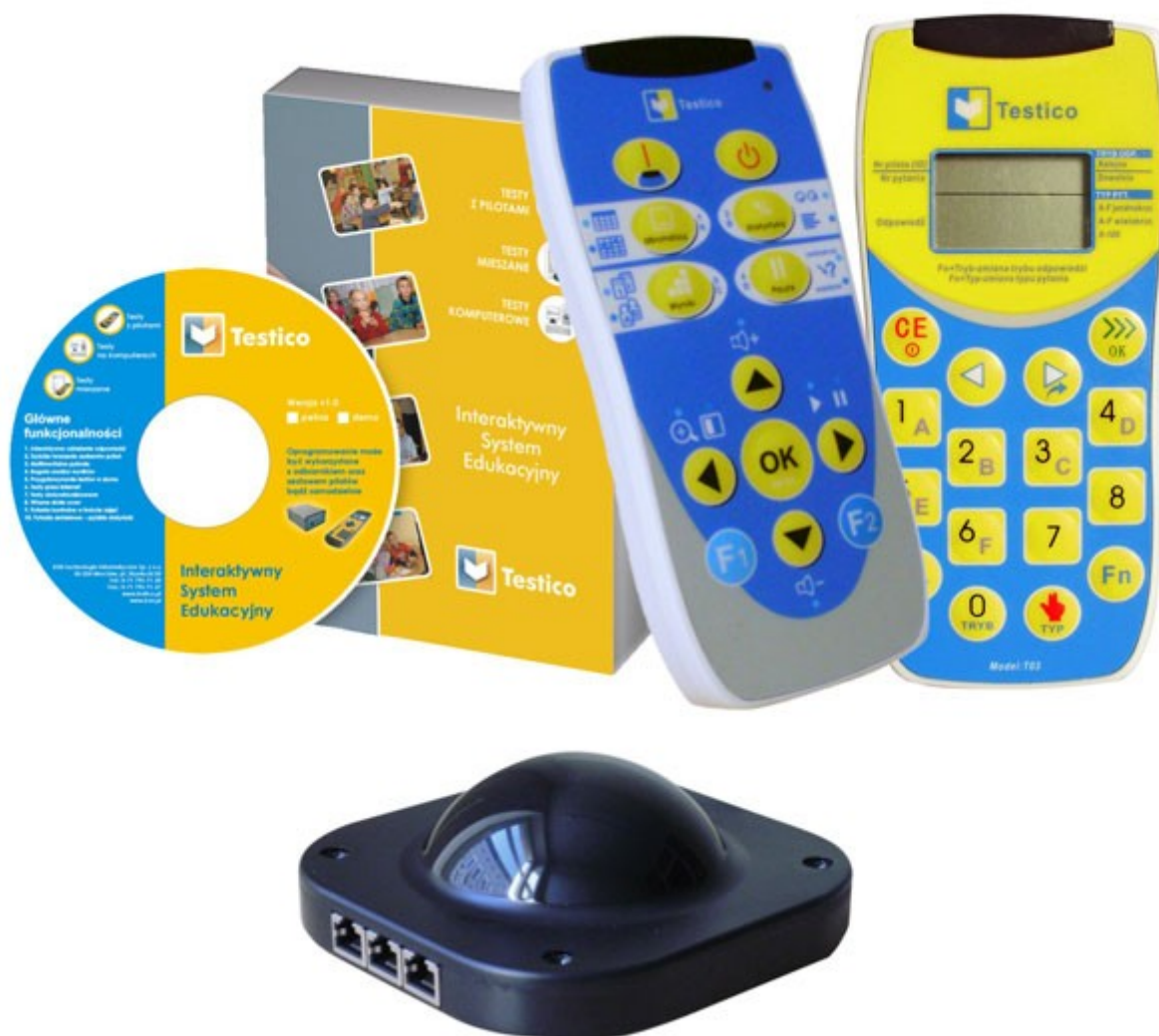
Ilustracja 1.2. Zestaw do obsługi konkursu interaktywnego – oprogramowanie, piloty, odbiornik

Konkurs interaktywny proponowany przez nas opiera się na nowatorskiej technologii wykorzystującej łączność radiową. Dzięki temu wiele osób w jednym czasie może odpowiadać na szereg pytań pojawiających się na ekranie telewizora lub rzutnika używając specjalnie do tego celu przygotowanych pilotów.