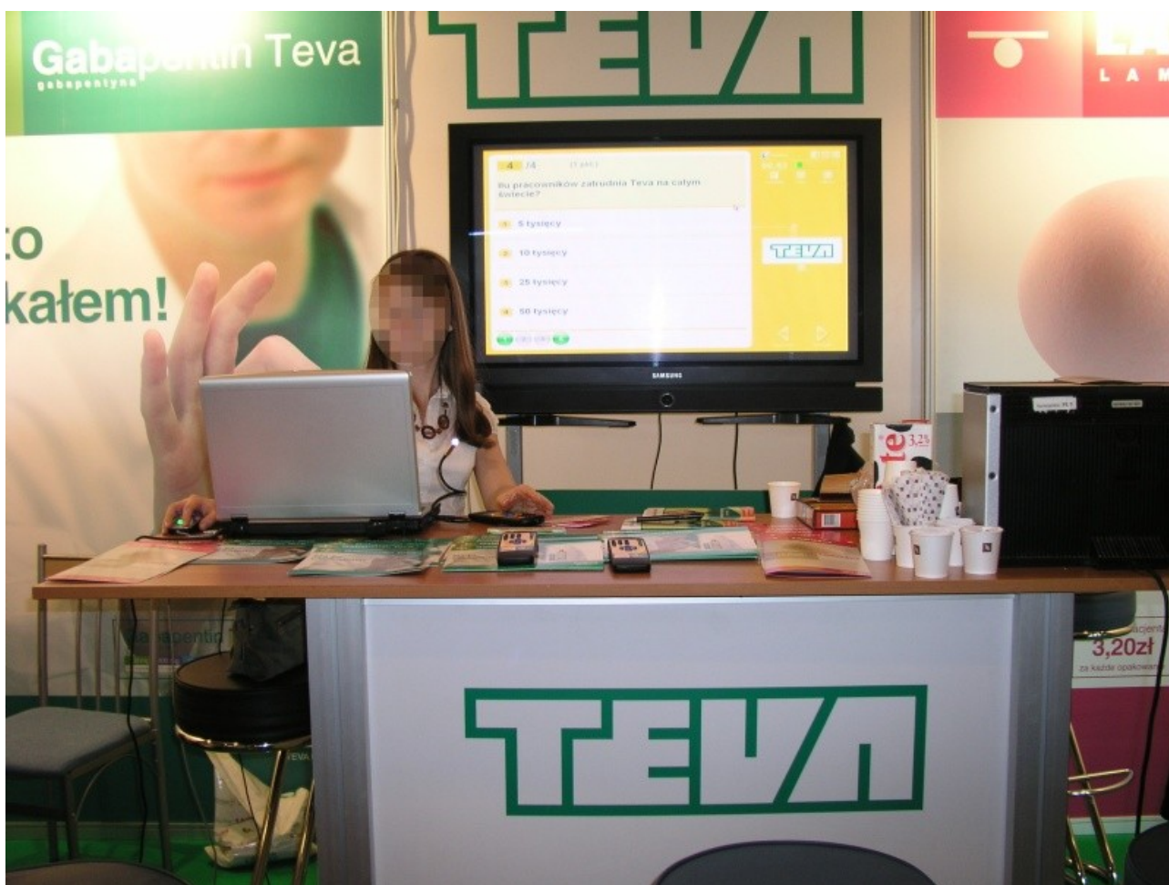
Ilustracja 2.2. Przykład konkursu na targach

Dzięki temu rozwiązaniu można w łatwy sposób zainteresować i przyciągnąć uwagę przechodzących obok osób. Możliwość rywalizacji oraz wygrania nagród jest kolejnym czynnikiem wpływającym na zainteresowanie potencjalnych klientów. Używany przez nas system pozwala na przygotowanie bardzo wielu rodzajów testów, quizów i konkursów. Możliwe jest przygotowanie pytań jedno- i wielokrotnego wyboru. Pytania mogą być uporządkowane lub losowe. Mogą zawierać multimedia takie jak dźwięki, obrazy lub filmy. Uczestnicy mogą rywalizować ze sobą w tym samym czasie (ogłoszenie wyników następuje po zakończeniu odpowiedzi na pytania), lub osobno (ogłoszenie wyników następuje na przykład co godzinę). Grupy uczestników mogą liczyć od jednej do kilkuset osób. Czas na odpowiedź może być dowolna lub ograniczona do ustalonej liczby sekund lub minut. Scenariuszy może być na prawdę wiele, dowolność i możliwości oprogramowania są na bardzo duże.