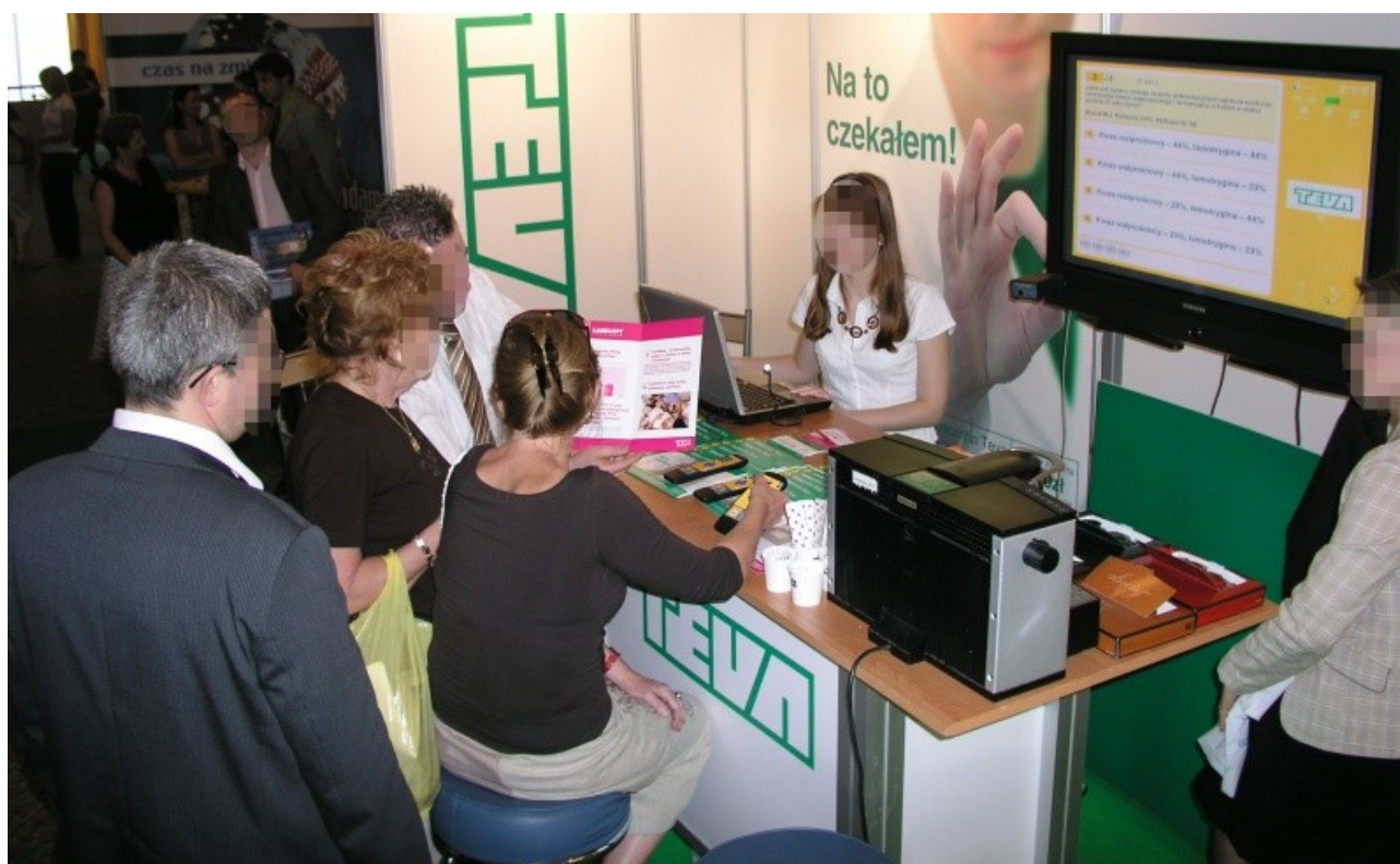
Ilustracja 2.4. Uczestnicy przykładowego konkursu