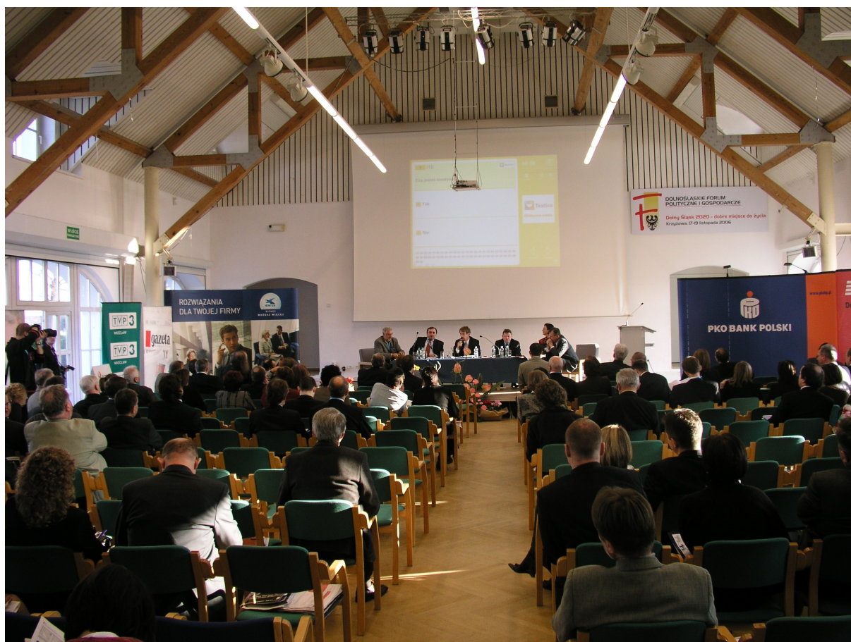
Ilustracja 4.1. Głosowanie na zgromadzeniu

• Testy i egzaminy - oferujemy usługę przeprowadzenia interaktywnego sprawdzianu wiedzy. Jesteśmy w stanie wprowadzić dostarczone pytania z zachowaniem pełnej poufności danych. Testy mogą zawierać multimedia takie jak dźwięki, obrazy lub filmy. Możliwe jest zaprezentowanie wyników testu po każdym pytaniu.