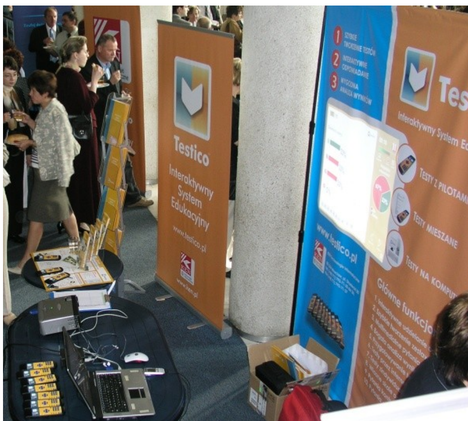
Ilustracja 3.1. Zestaw sprzętu do konkursów w akcji